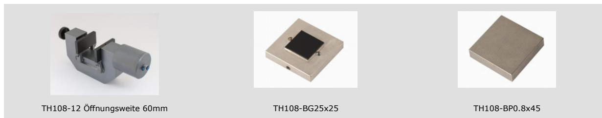
TH108-12 Öffnungsweite 60mm

Beispiele für weitere Ausführungen und kundenspezifische Anfertigungen