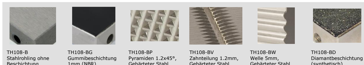
TH108-B Stahlrohling ohne Beschichtung