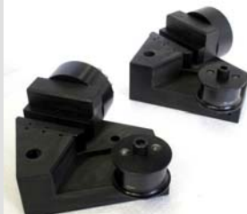
TH170-150+Ko 150kN Version, hydraulisch