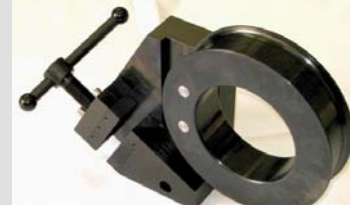
TH170-100 100kN Version