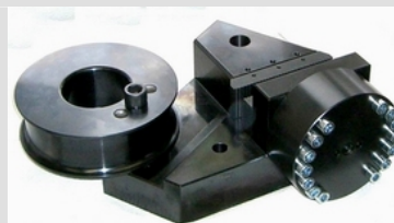
TH170-250+Ko 250 kN Version, hydraulisch