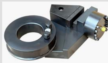
TH170-100+Ko 100 kN Version, hydraulisch