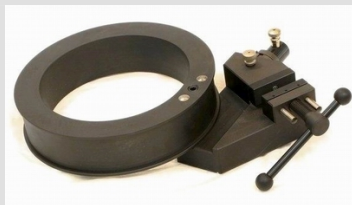
TH170-50-D296-B60 Rollendurchmesser 296 mm, Breite 60 mm