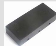
TH170-50-BP0.5x45° Sonderbacken kleine Pyramidenrändelung