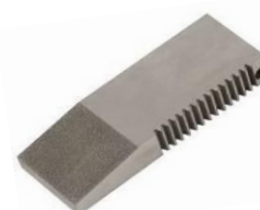
TH256-BD Diamant Backen