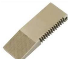
TH256-BP Pyramiden Backen