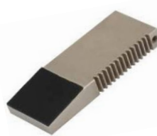
TH256-BG Gummi Backen