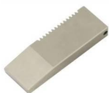
TH256-B Blanke Backen