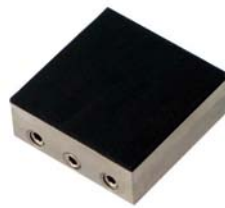
TH240k-BG Gummibeschichtete Backen