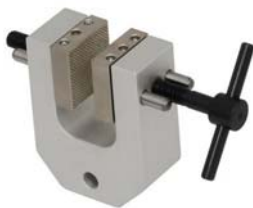
TH240k Kleiner Schraubspannkopf TH240k Datenblatt.pdf