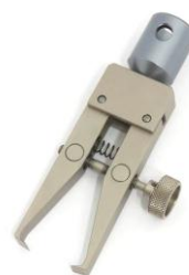
THS466-H1-Af159 Adapter 15.9mm (5/8")