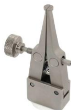
THS466-HD8-M4 Zum Halten von Kappen von innen