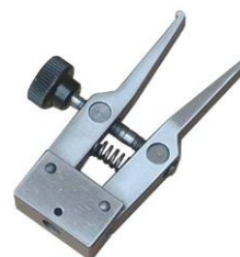
THS466-H2-M4 Zum Halten von Kappen von innen