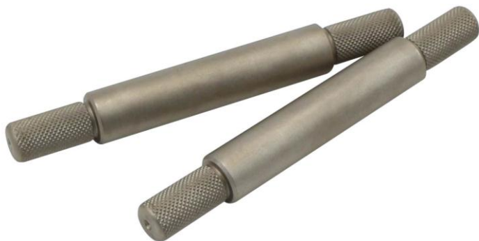
TH127-12.7x60-okp Absteckstifte ohne Kopf