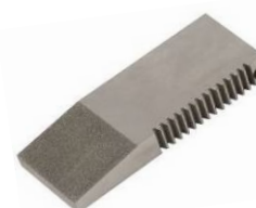
TH256-BD Diamant Backen