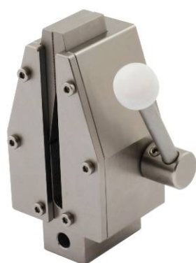
Artikel-Nr.: TH256-10-T280 Sonderversion für den Temperaturbereich -70...+280°C

Spannbacken mit abweichenden Abmessungen und Oberflächenbeschichtungen auf Anfrage