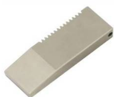
TH256-B Blanke Backen