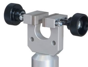
Für das untere Spannzeug empfehlen wir TH227+BP25