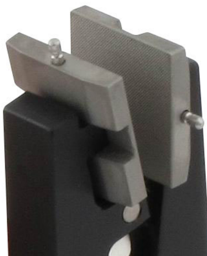
THS205k-BP20x20 Pyramidenbacken 20x20 mm